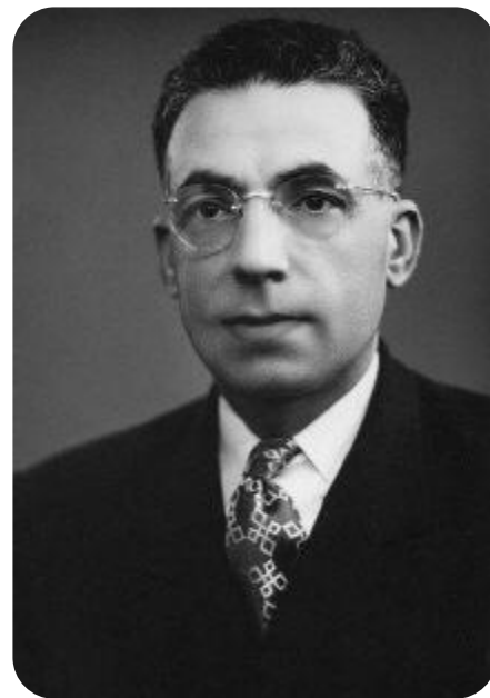
На фотографии: Али Акбар Фурутан в 1951 году, когда он был назначен Десницей Дела Божьего

Материал взят со страниц «Архивы — память общины» .