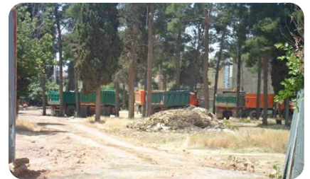
Грузовики во время сноса кладбища Бахаи в Ширазе